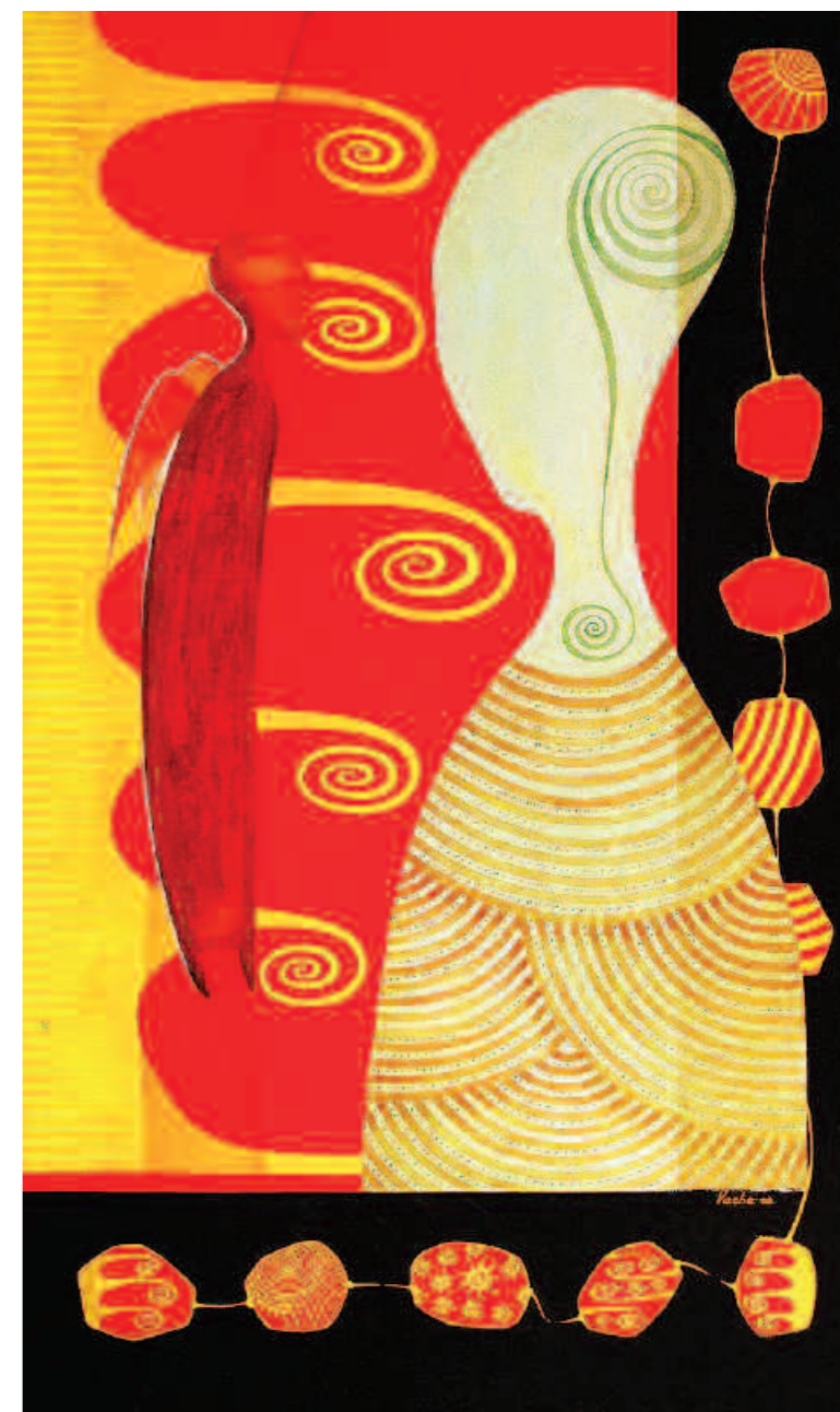
Beforewish, 2005 Перед мечтой. 2005

Художник много работает над созданием своего собственного оригинального стиля. Он не придумывает свои картины как некие ребусы и не списывает их с природы. Рождаясь непосредственно на холсте, его живопись представляет собой увлекательную импровизацию, творящуюся каждый раз здесь и сейчас. Хаос форм и красок претворяется на его холстах в гармонию, благодаря удивительно тонкому чувству колорита. Редкий, почти уникальный дар – создание беспредметных полотен, и Ваче Чхаидзе этим даром владеет в полной мере.