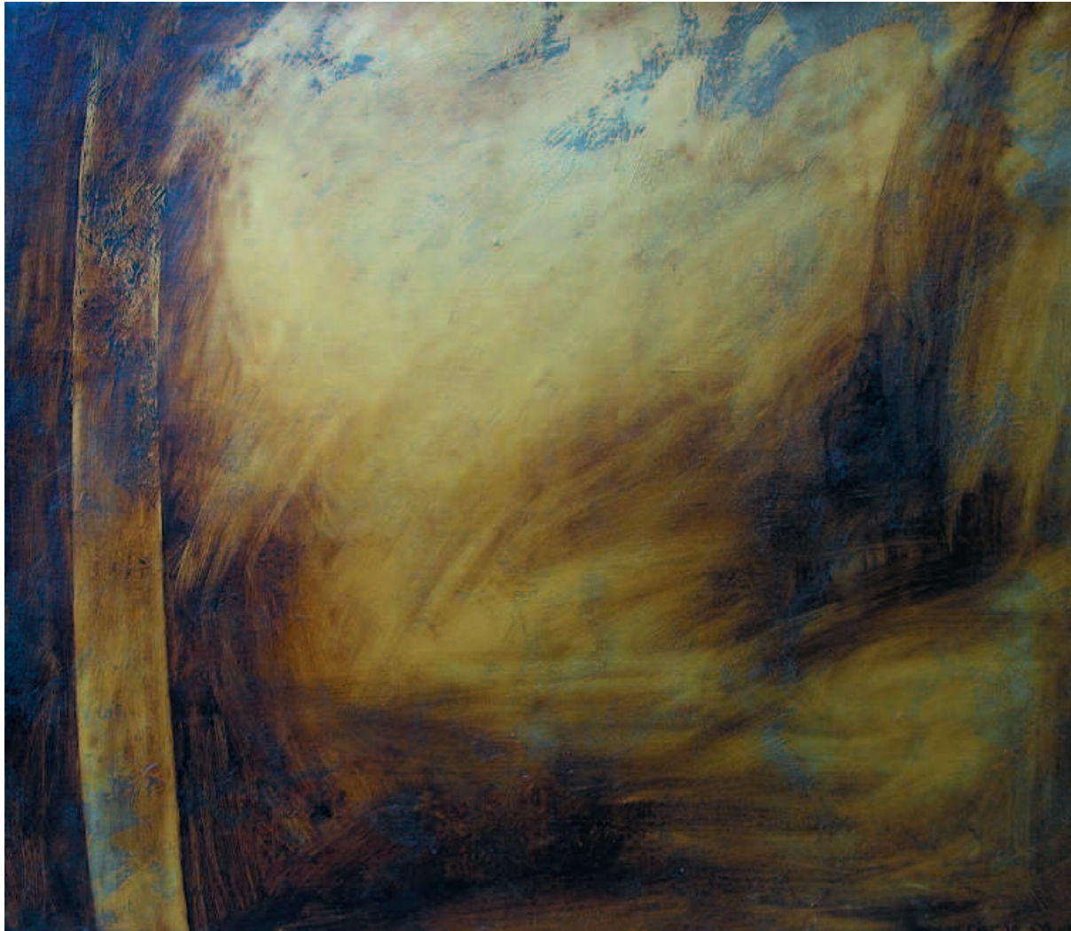
Beyond the Fog, 2006 За туманом. 2006