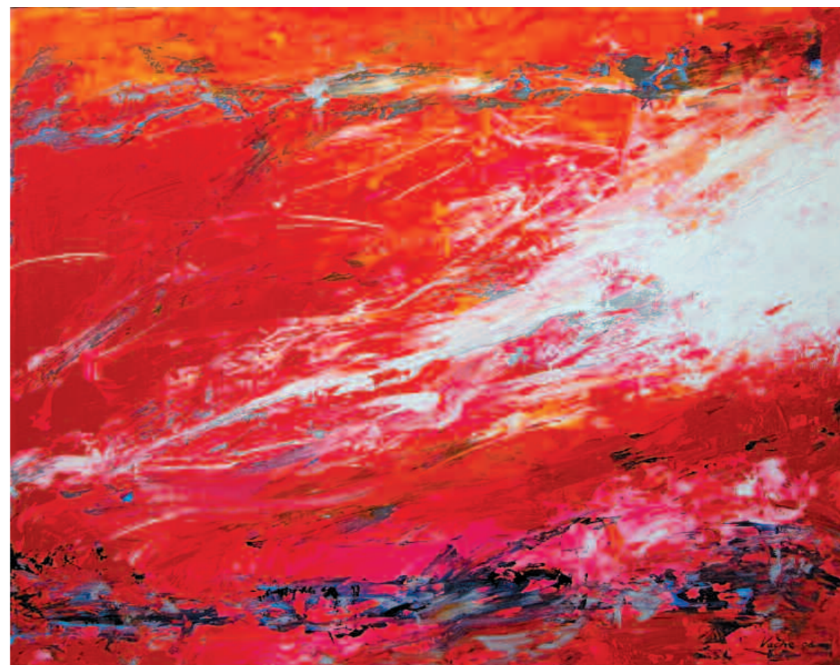
Red Sea, 2006 Красное море. 2006