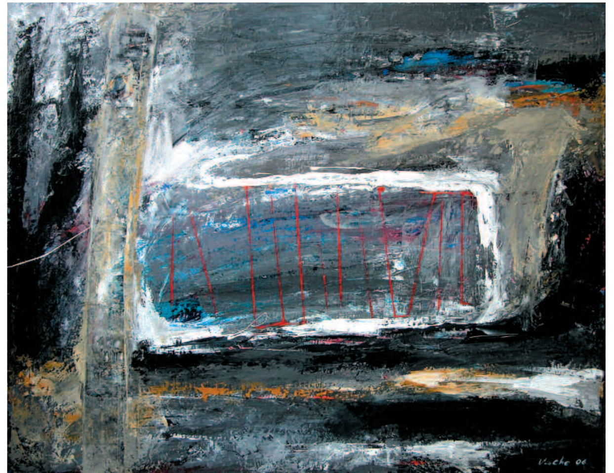
Cage, 2007 Клетка. 2007