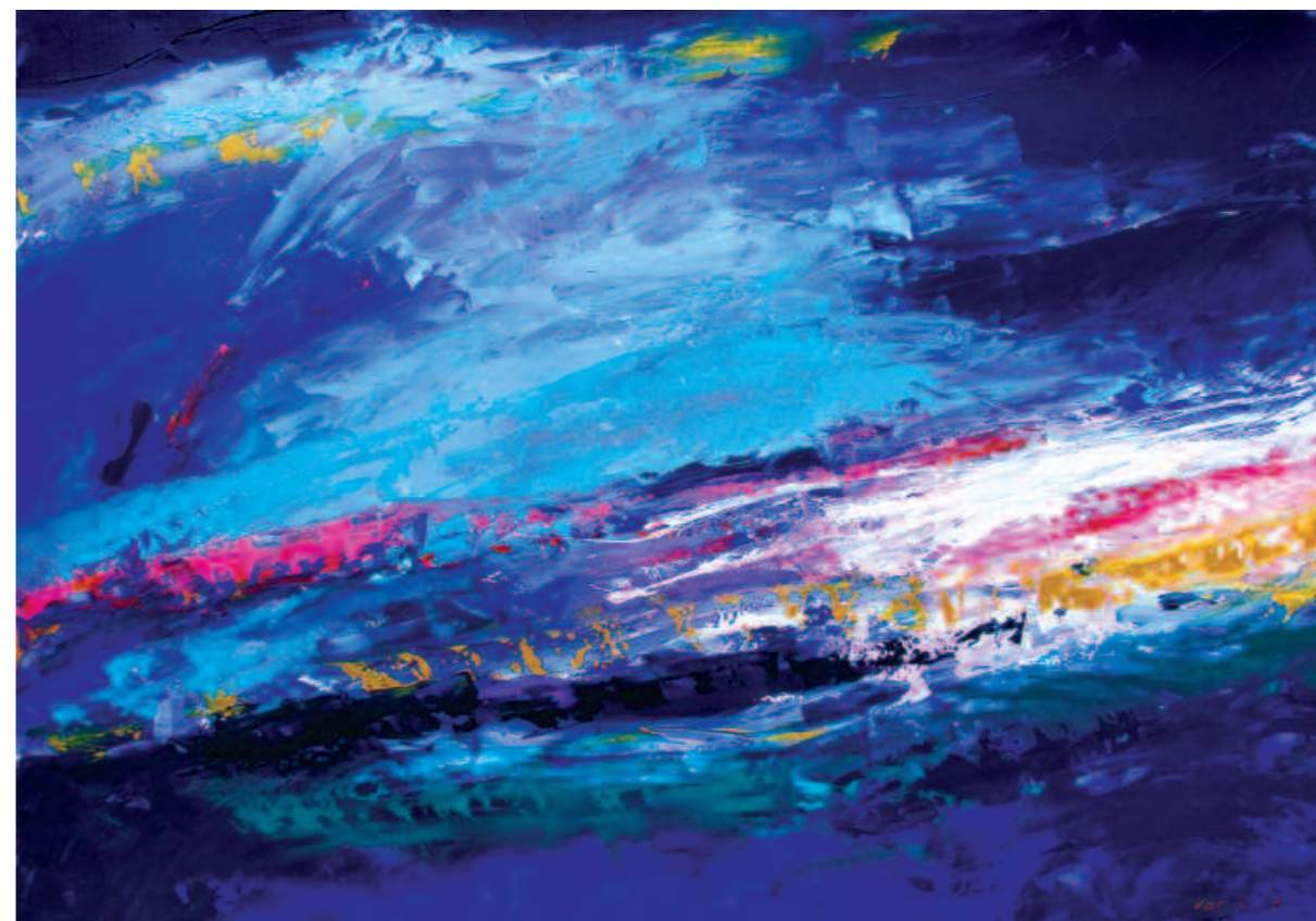
Blue Sea, 2006 Синее Море. 2006