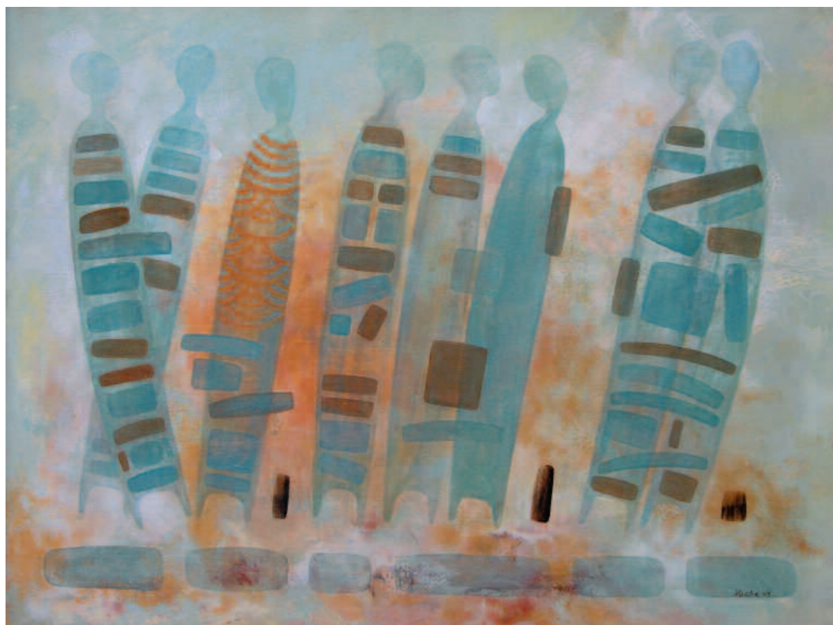
Dance, 2006 Танец. 2006