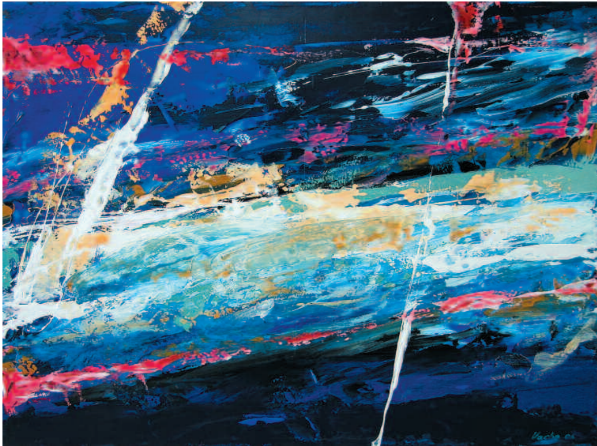
Composition, 2006 Композиция. 2006