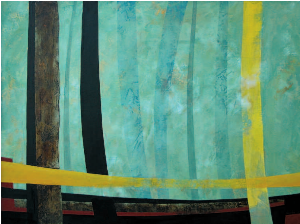
Forest Silhouette, 2006 Лесной силуэт. 2006