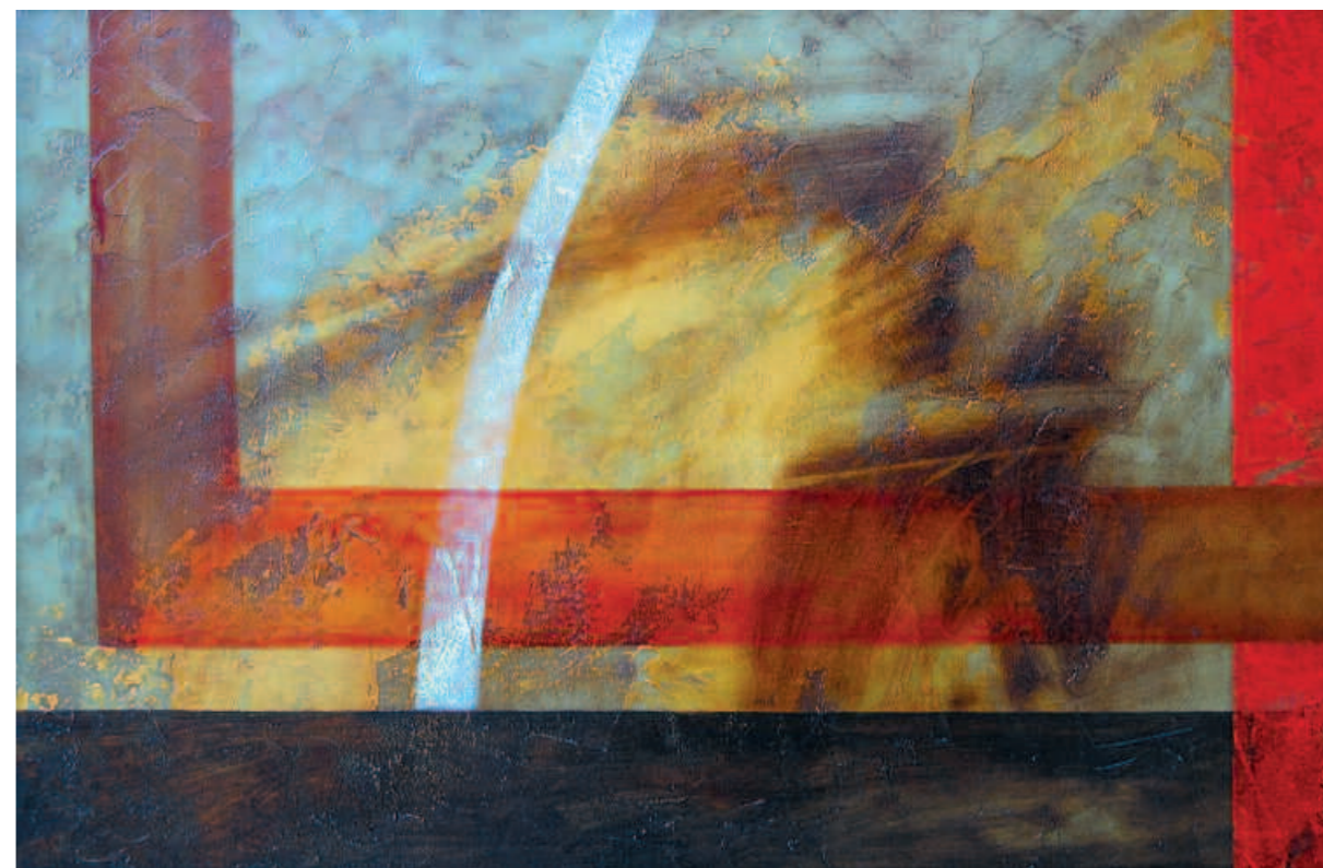
Rainbow, 2006 Радуга. 2006