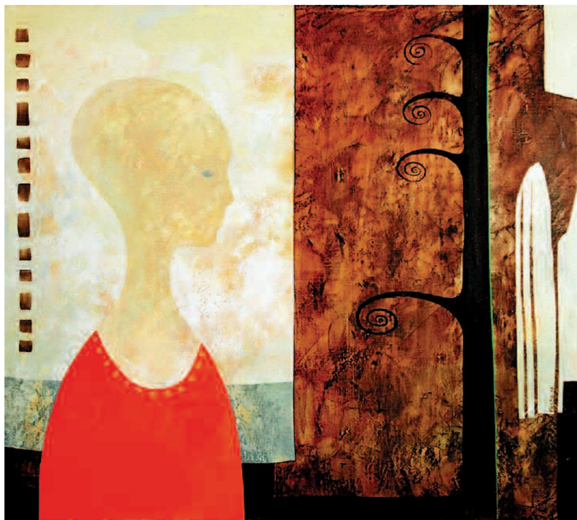
Dream, 2006 Сон. 2006