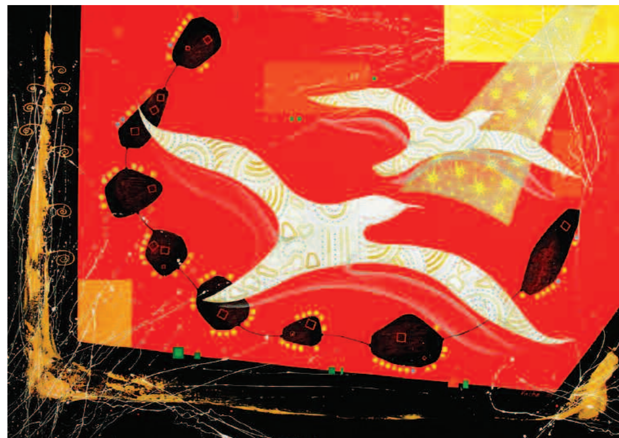
Johnathan Seagull, 2005 Чайка Джонатан. 2005