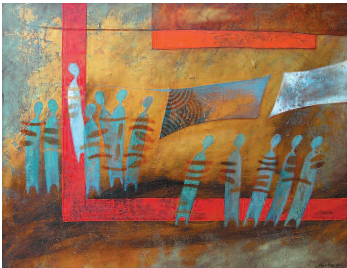
Red Road, 2006 Красная дорога. 2006