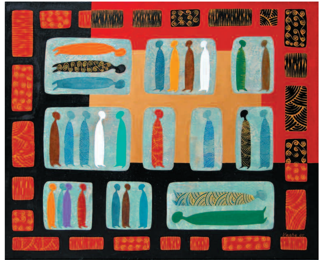
Beyond the Edge, 2006 За гранью. 2006