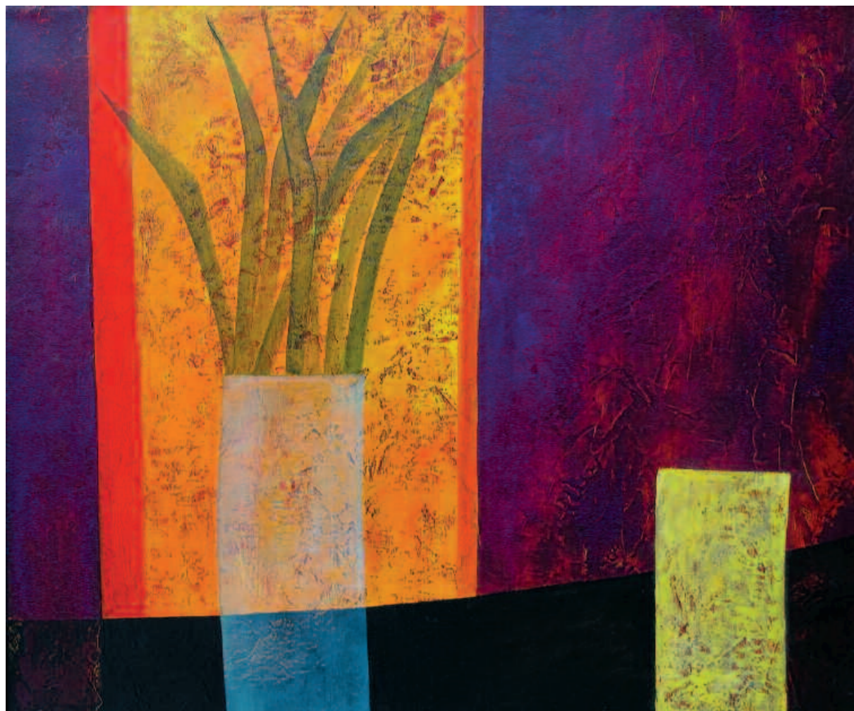
Still life, 2006 Натюрморт. 2006