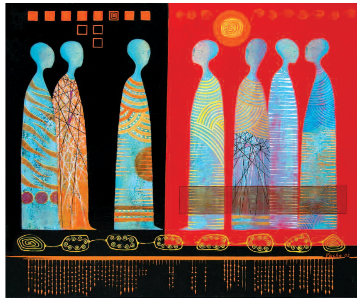
Edge, 2006 Грань. 2006