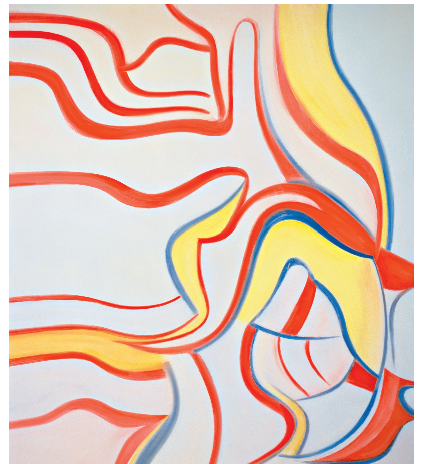
Willem de Kooning, Triptychon (Ohne Titel V), 1985