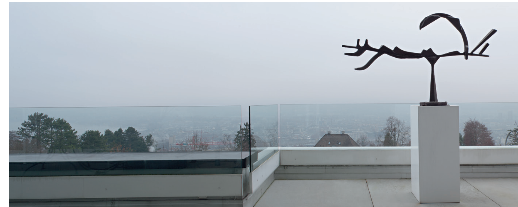
David Smith (Außenansicht der Fondation Hubert Looser) Arc in Quares, 1951, © VBK, Wien, 2012