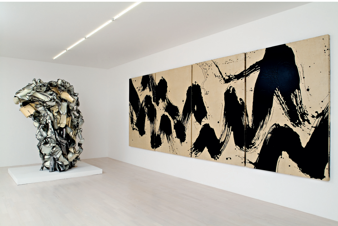
John Chamberlain, Archaic Stodge (No. 21555), 1991, © VBK, Wien, 2012, Fabienne Verdier, Tempête de flux, 2005 © Fabienne Verdier, Foto: Gaechter + Claissen, Fotografen, Zürich