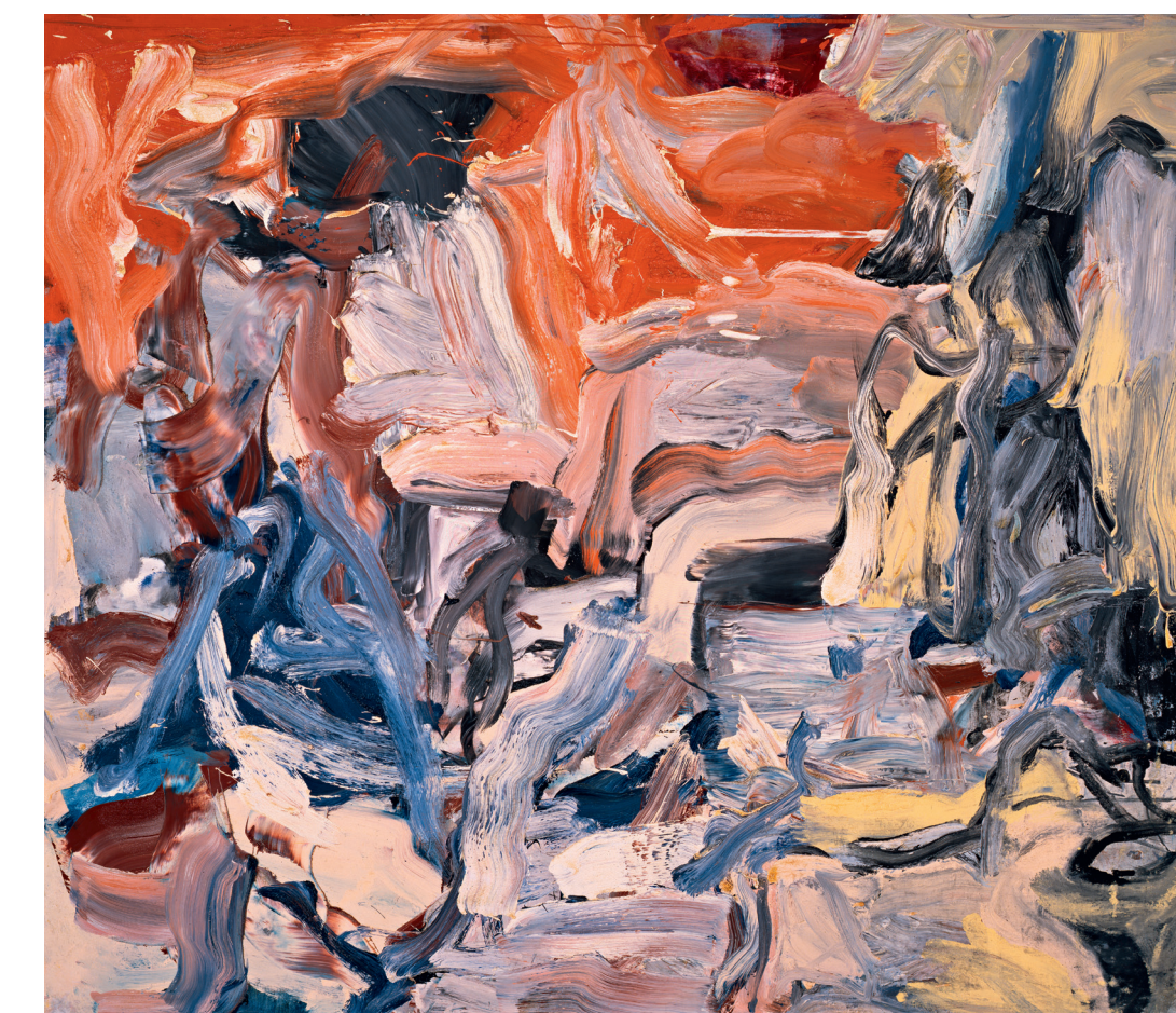
Willem de Kooning, Untitled IX, 1977, © VBK, Wien, 2012