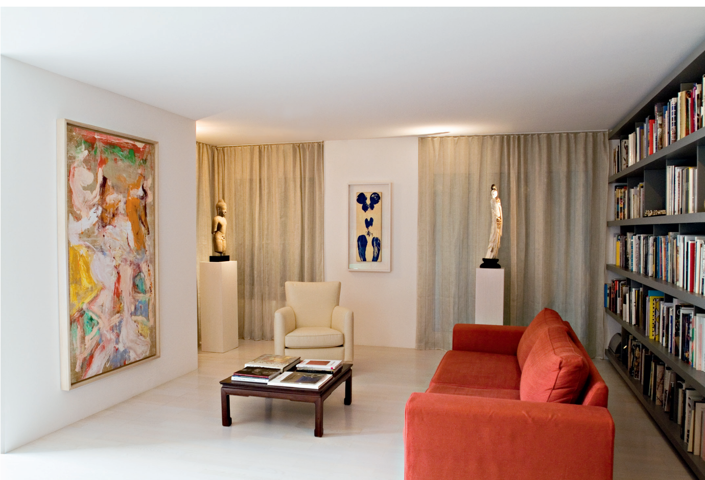
Einblick in die Bibliothek der Fondation Hubert Looser mit Werken von Yves Klein und Willem de Kooning, sowie einer antiken Skulptur aus Kambodscha, Foto: Gaechter + Claissen, Fotografen, Zürich