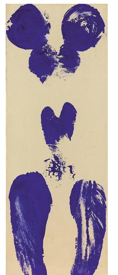
Yves Klein, ANX 37, um 1960, © VBK, Wien, 2012