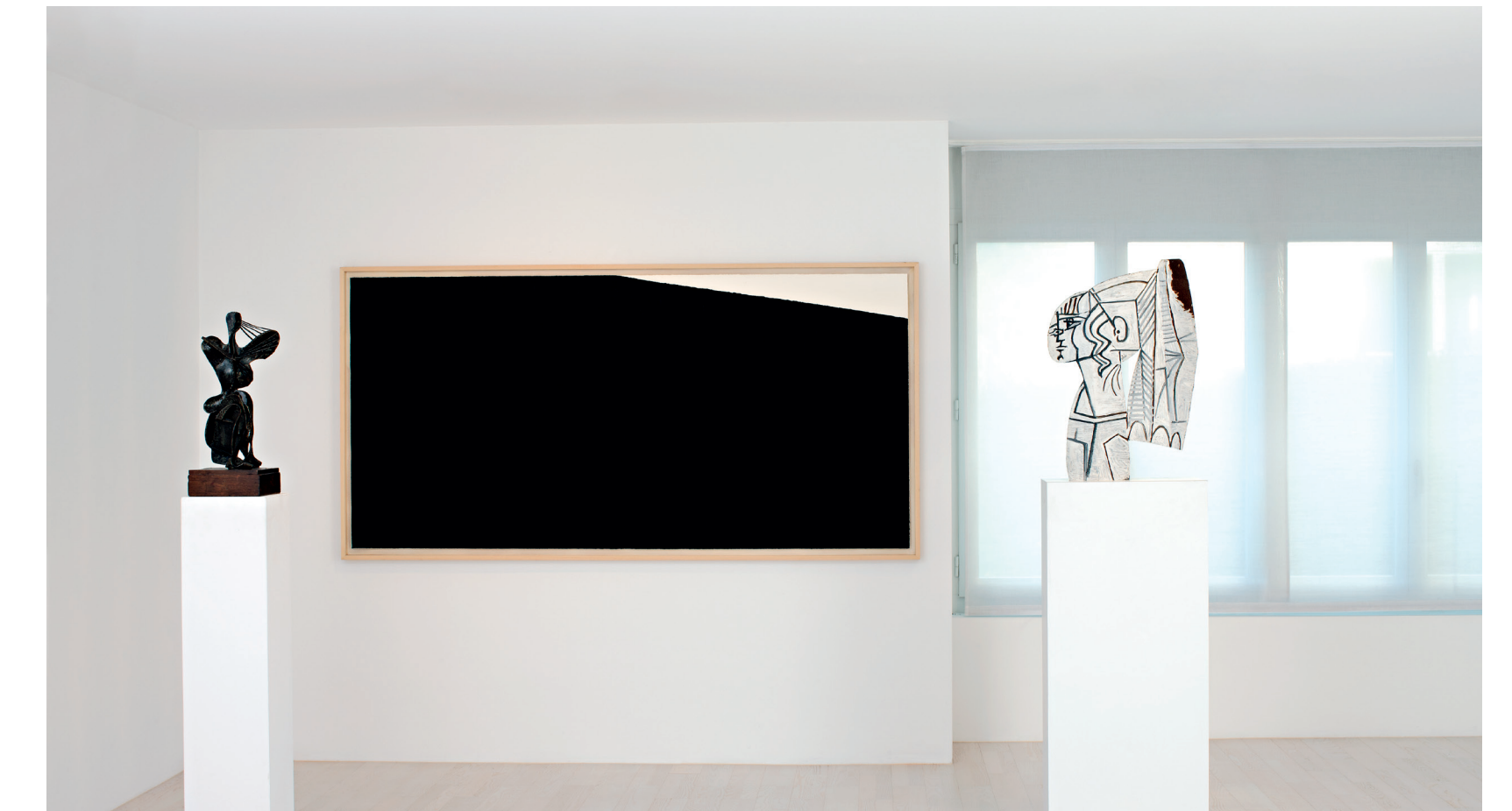
David Smith, Woman Music, 1944, Richard Serra, Rosa Parks, 1987, Pablo Picasso, Sylvette, 1954